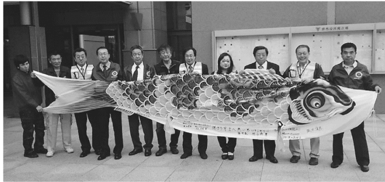
堺市役所で行われた出発式。子どもたちの元気を祈る鯉のぼりも届けられた