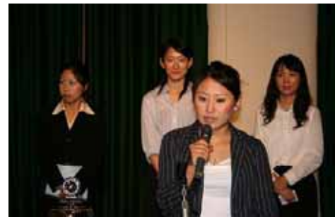
青少年育成月間・卓話・ローテックスの方々