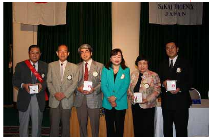
9 月度・会員誕生の御祝を受けられた皆様