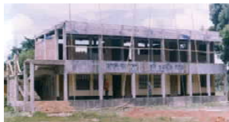
建設中の日本-バングラディッシュ友好大学