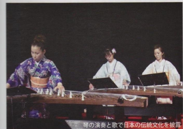
琴の演奏と歌で日本の伝統文化を披露

現地へは日本から琴を持っていかなくてはならない。そこで、クラブ会員が立ち上がってくれた。日本から琴を運び、準備し、演奏し、記録し、日本に持ち帰るとい